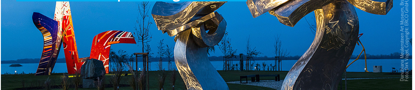
Danijana Meulensteen Art Museum, Bratislava – für ERCO Lichtwerkzeugen beleuchtet

ERCO führt eine SAP Fiori Applikation ein, um Informationen in Echtzeit zu visualisieren und Echtzeit-Reports zu generieren.